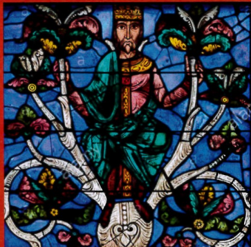
Bild: Ausschnitt aus Wurzel Jesse - Chartres

Sonntag | 16. Dezember 2018 | 17:00 Uhr Sandkirche Aschaffenburg